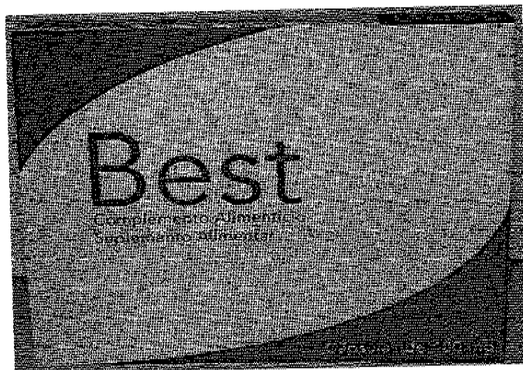
Fig.1: Imagen del envase del producto BEST Cápsulas

La información, permanentemente actualizada, de todos los medicamentos autorizados y controlados por la AEMPS está disponible en la web de la Agencia, http://www.aemps.gob.es , dentro del apartado Centro de Información online de Medicamentos Autorizados (CIMA).